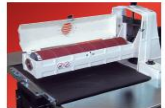
Hiomanauhojen kiinnittäminen sujuu helposti