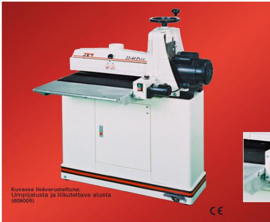
Kuvassa lisävarusteltuna: Umpijalusta ja liikuteltava alusta (609005)