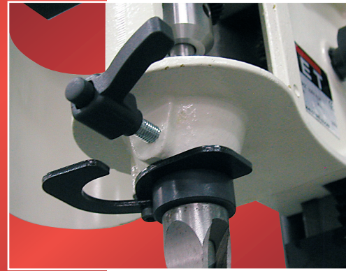
Talttaporan kiinnitys välikkappaleeseen