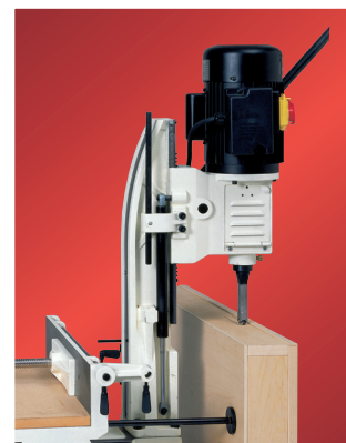
Kone kääntyy 180° taakse