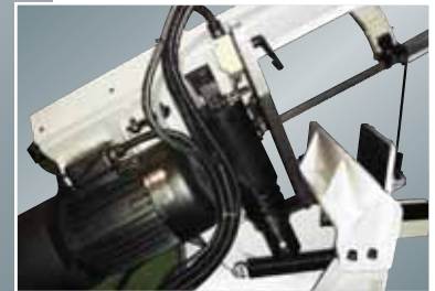
Automaattinen palautus sahauksen jälkeen