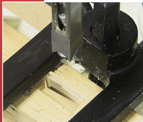
Puupaneelien ja ovihelojen tapitus helposti ja nopeasti