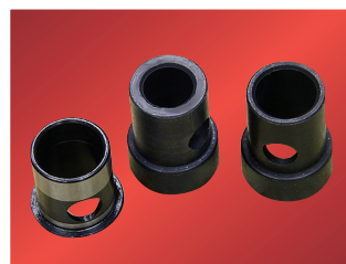
Välikappale ja istukka eri karakokoja varten (5/8", 3/4", 13/16")