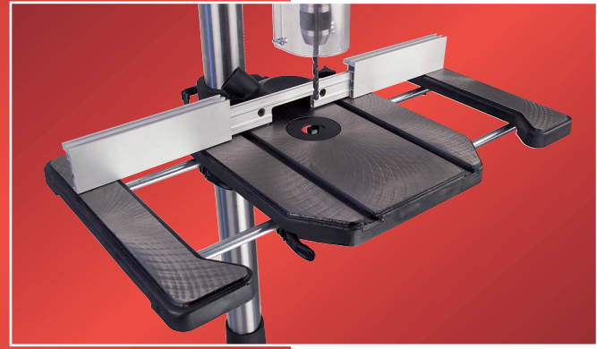
Vaste jatko-osilla, stopparilla ja puruimuliitoksella