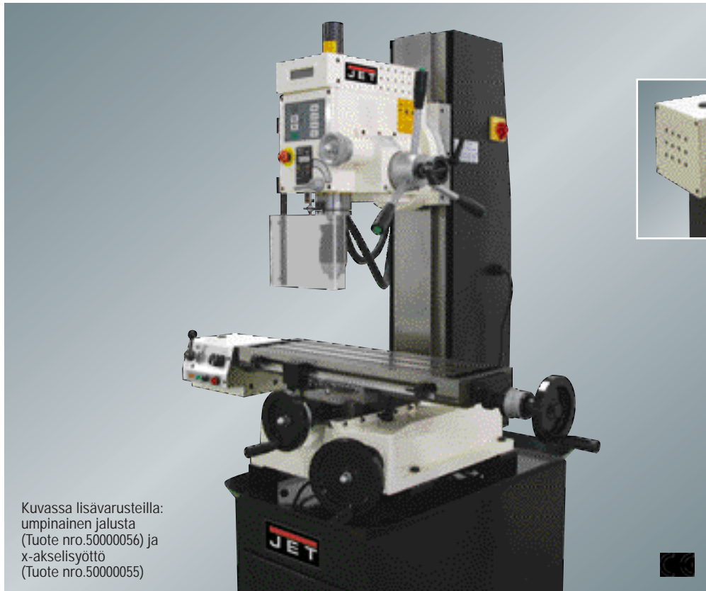
Kuvassa lisävarusteilla: umpinainen jalusta (Tuote nro.50000056) ja x-akselisyyttö (Tuote nro.50000055)