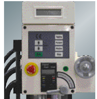
Digitaalinen näyttö karan kierroksille ja karan liikkeelle