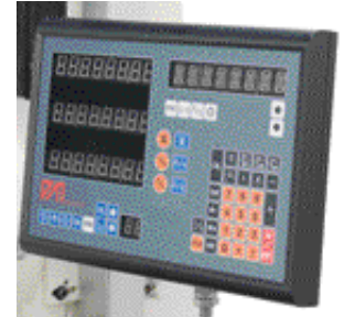
3-akseli digitaalinen näyttö (JMD-45PFD)