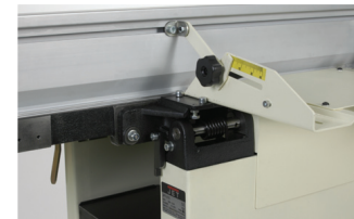
Kaksoisohjattu nivelohjain, kallistuu helposti