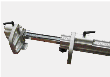
Ulosvedettävä ohjuri mittavasteella