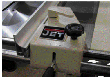
Tarkka halkaisuohjain pikalukituksella