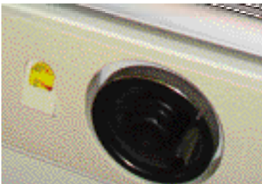
Helppo kallistuskulman osoitin