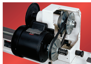
Useita karan pyörimisnopeuksia 450-2500 rpm