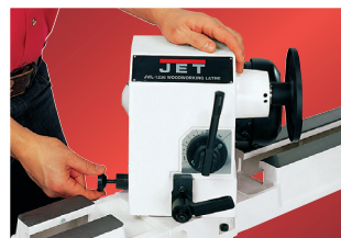
Karpylkkä kääntyy nopeasti ja lukittuu paikalleen helpottaen näin sorvauksen suoritusta ja parantaen työstön aikaista näkyvyyttä