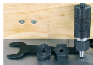
Koneen kara ja pidike vaihdettavia karoja varten – 30 mm kara ja 8 ja 12 mm vakioholkit