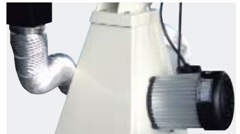
Yhdistetty hionnan ja pölynpoiston järjestelmä (MBG-150DC)