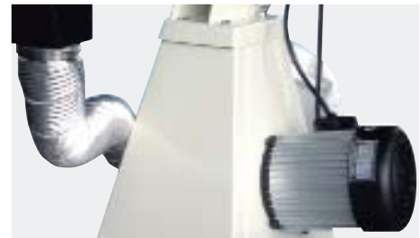
Yhdistetty hionnan ja pölynpoiston järjestelmä (MBG-75DC)