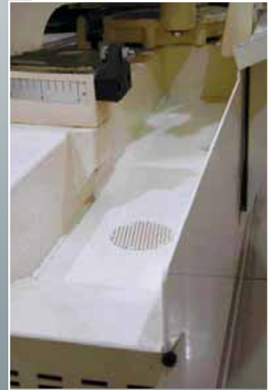
Helposti puhdistettava lastukaukalo