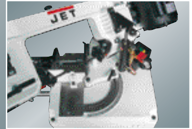
Sahan varsi kääntyy oikealle ja vasemmalle