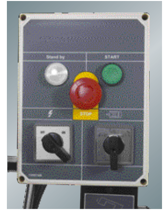
2 teränopeutta 2-kierrosmoottori (MBS-910CS)