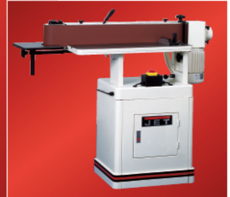
EHVS-80 ilman oskillointia