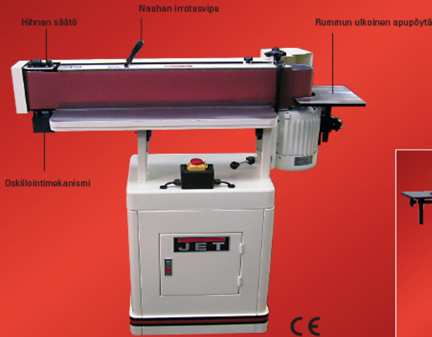
Kuvassa hihna pystyasennossa